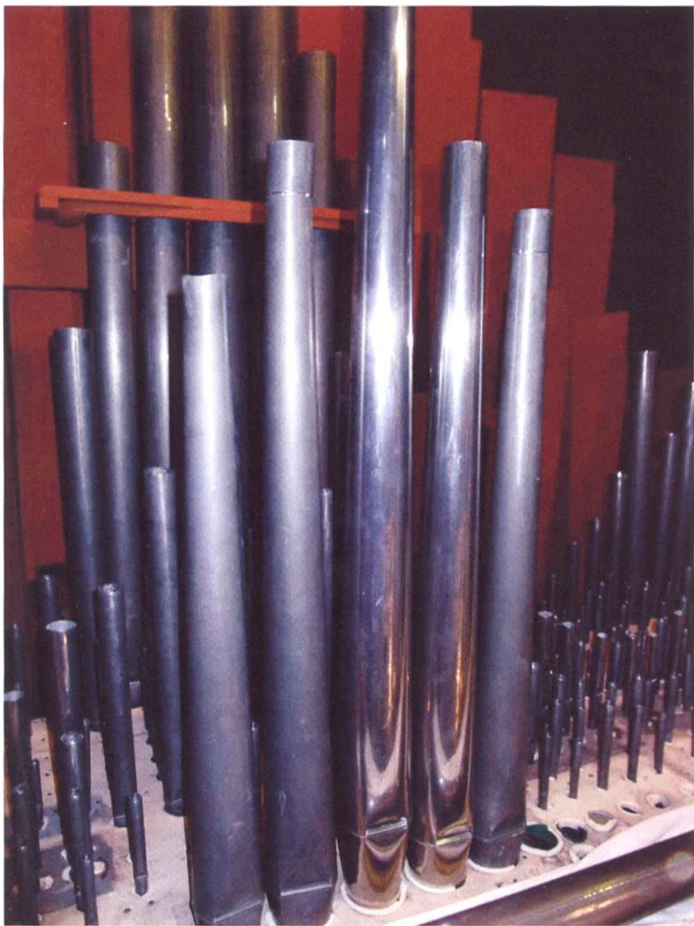
Rimontaggio: canne rimesse in forma e saldate; integrazione di due canne nuove